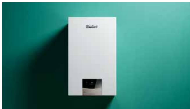
ecoTEC plus VUW

Zahvaljujući njegovoj novoj inteligentnoj značajki „IoniDetect“, uređaj potpuno samostalno upravlja promjenama u vrsti i kvaliteti plina. Svojim kupcima uvijek možete jamčiti optimalno izgaranje, a da sami niste morali ništa učiniti.