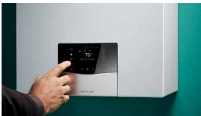
Udobnost upravljanja putem integriranog rada na dodir

Novi usklađen dizajn i koncept rada sučelja naših plinskih kondenzacijskih uređaja za grijanje zajedno s našim regulatorima, ugradnju i korištenje čini bržim no ikada. Brza daljinska provjera i prilagodba uređaja za grijanje putem našega novog sensoCOMFORT regulatora i aplikacije sensoAPP.