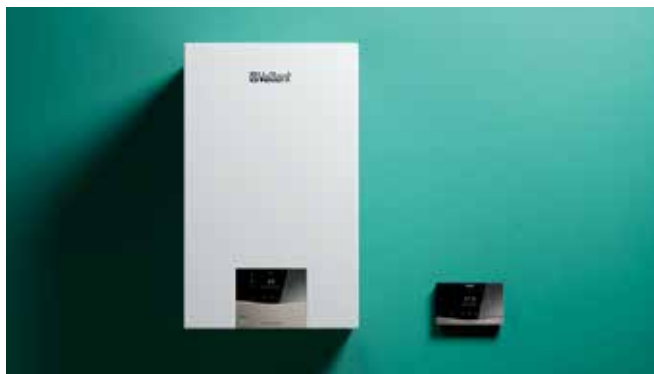
ecoTEC exclusive uređaj sa sensoCOMFORT regulatorom

uređaji opremljeni izmjenjivačem topline od nehrđajućeg čelika za najbolji mogući rad. Uz dokazane i pouzdane komplete za ugradnju, uvelike vam olakšavaju montažu. Zahvaljujući uklonjivim dijelovima kućišta, sve su glavne komponente savršeno dostupne za lako održavanje.