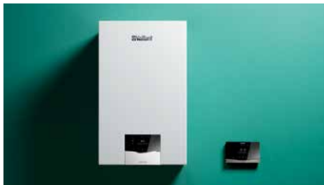
Najbolji omjer cijene i radnih značajki: Povežite ecoTEC plus uređaj sa regulatorom sensoHOME